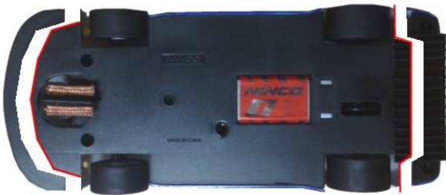
Dodge Viper GTS-R - Scelextric