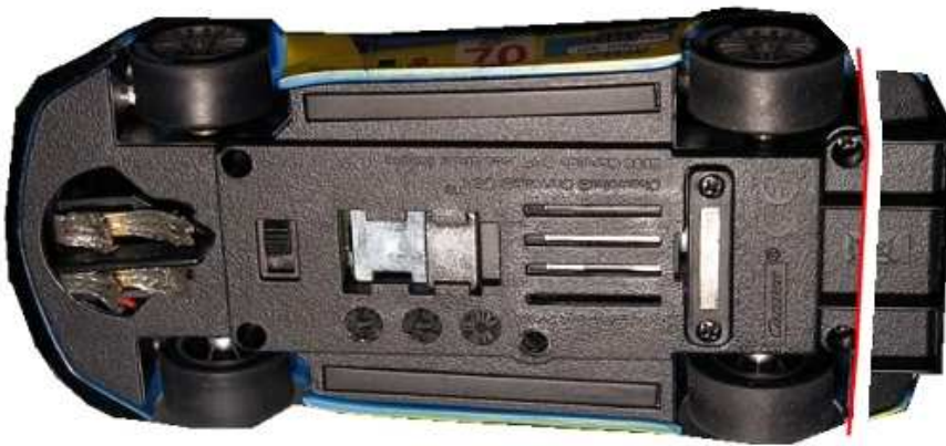
Corvette C6R – SCX