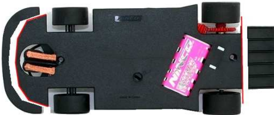
Chrysler Viper GTS-R - Fly