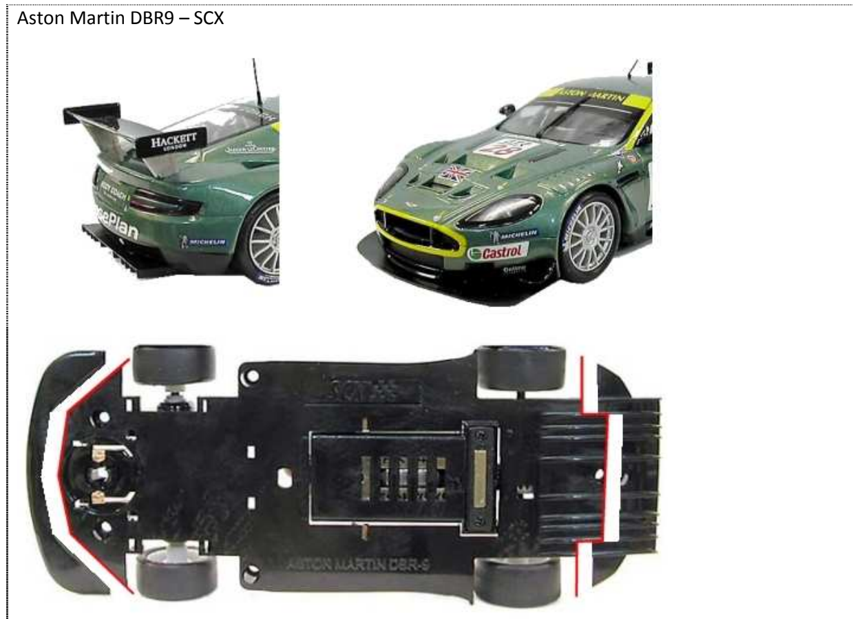
Aston Martin DBR9 – SCX